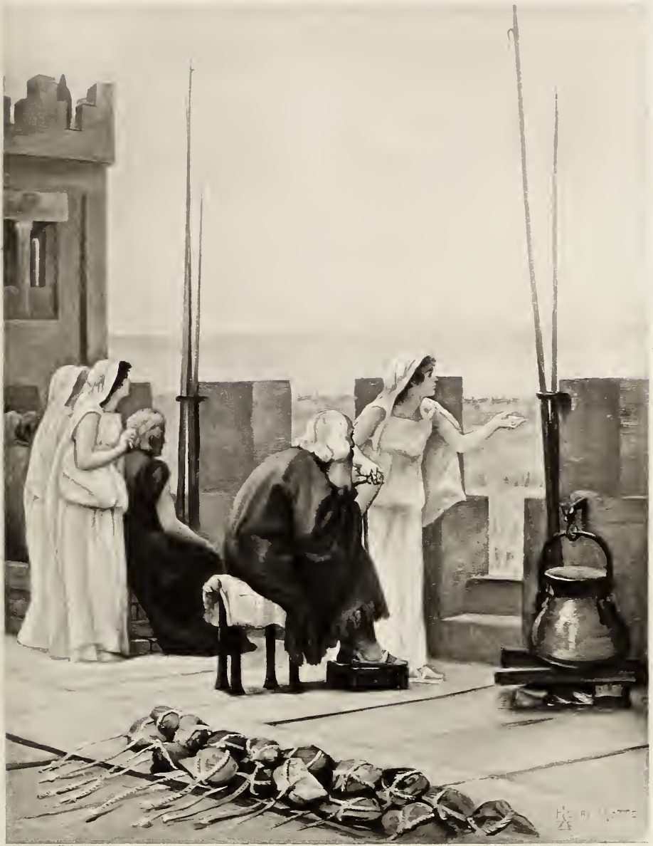
H. MOTTE INV